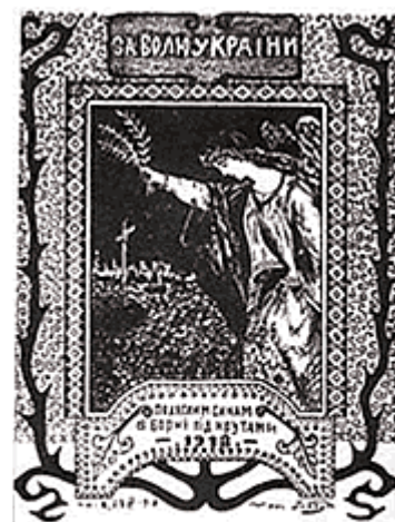
«За волю України. Полеглим синам в борні під Крутами» — київський плакат 1918 року