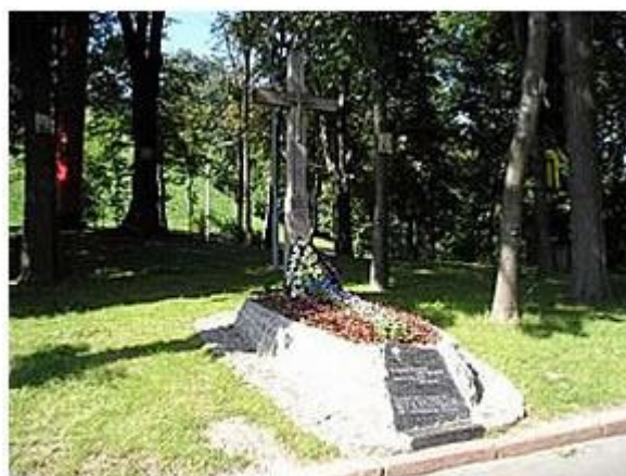
Символічна могила і дерев'яний хрест крутян на Аскольдовій могилі у Києві.

Ведучий 1. 19 березня на Аскольдовій могилі відбувся грандіозний похорон убієнних за вільну, незалежну Україну. На