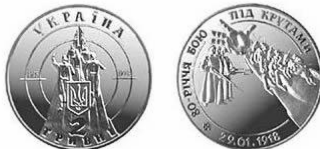
ПАМ'ЯТНА МОНЕТА, НОМІНАЛОМ У 2 ГРИВНІ, ПРИСВЯЧЕНА БИТВІ ПІД КРУТАМИ: АВЕРС ТА РЕВЕРС.

Ведучий 1. У 2006 році на місці битви встановлено пам'ятник і у 80-ті роковини битви монетним двором випущено в обіг пам'ятну гривню.